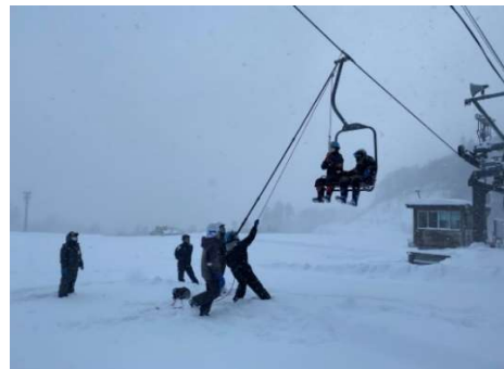
救助訓練(令和4年11月30日)