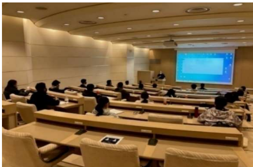
冬季全体研修(令和4年11月23日)

結果： ・ルスツにて、冬季全体研修・救助訓練に参加。 ・営業準備期間に、中山峠スキー場にて救助訓練実施。