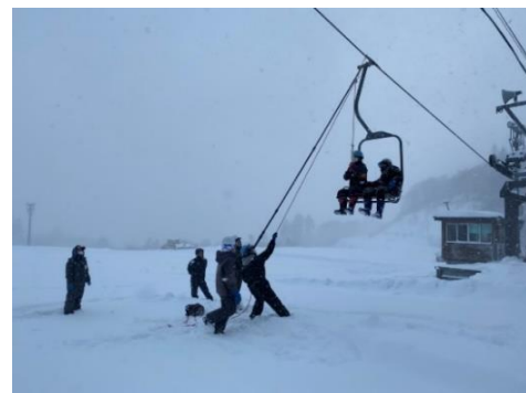
救助訓練(令和4年11月30日)