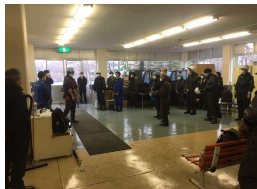
ルスツにて索道教育訓練(令和2年11月20日)