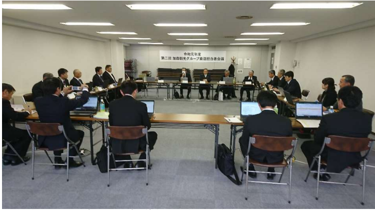
第二回加森観光索道担当者会議(令和元年11月14日)