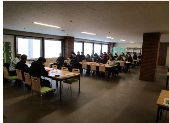
全体研修(令和元年11月20日)