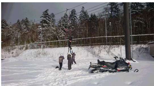
救助訓練(令和元年11月)

結果: 定期巡回による運行教育の実施とスキー場全体による救助訓練を実施しました。