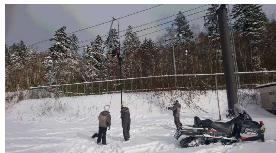
救助訓練(令和元年11月)