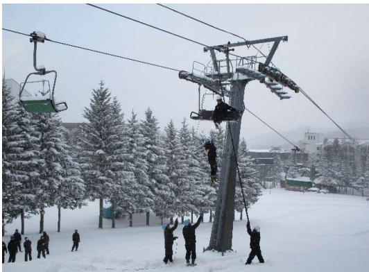
ルスツにて索道教育訓練(令和元年11月20日)