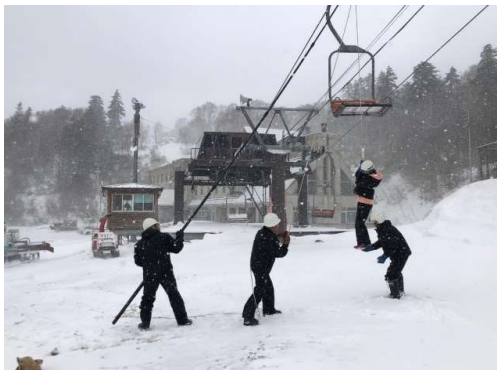
救助訓練(平成30年11月21日)

結果： 定期巡回による運行教育の実施とスキー場全体による救助訓練を実施しました。