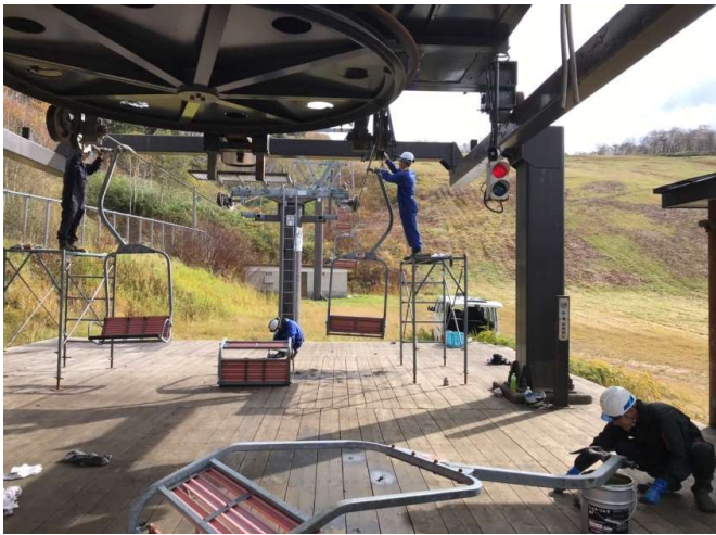
握索機点検、搬器取り付け(平成30年10月30日)