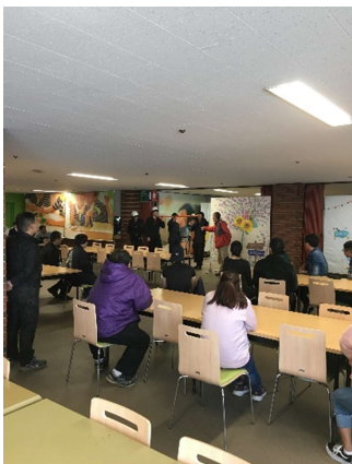
ルスツにて索道教育訓練(平成30年11月20日)

当スキー場では、スキー場営業期間の各月に索道従業員教育訓練を行い、万一の「索道事故や「災害」により、索道が運転不能となった場合を想定した乗客の救助訓練を実施しております(ルスツリゾートにて合同救助訓練・教育訓練実施)