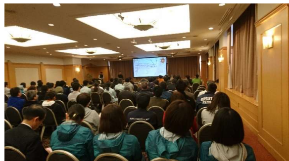
全体研修(平成30年11月20日)