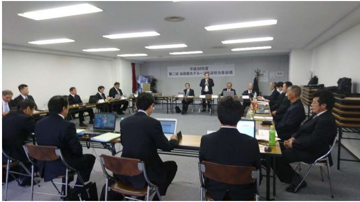
第二回加森観光索道担当者会議(平成30年11月8日)