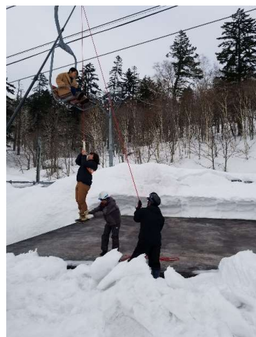
救助訓練(平成31年3月29日)